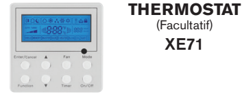
THERMOSTAT (Facultatif) XE71