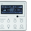
THERMOSTAT (Inclus) XK19