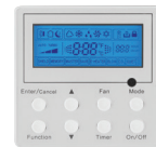
THERMOSTAT (Inclus) XE71