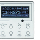
THERMOSTAT (Inclus) XK19